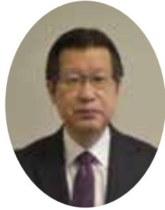
兵庫労働局長 鈴木 一光