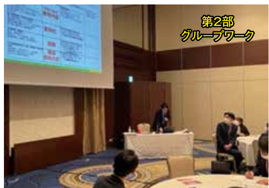
第2部 グループワーク