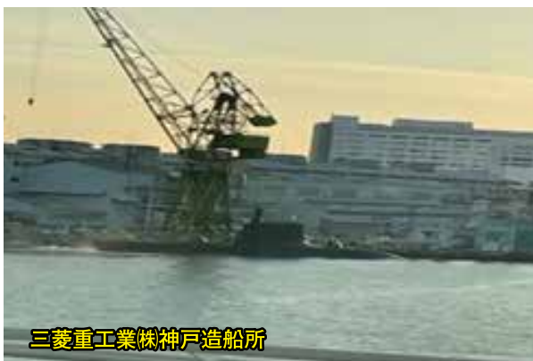
三菱重工業株式会社神戸造船所