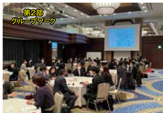
第2部 グループワーク