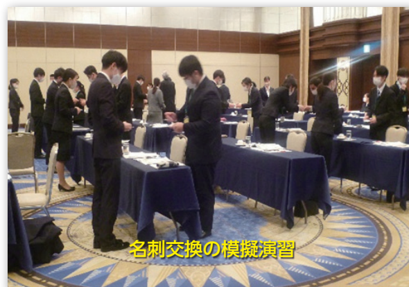
名刺交換の模擬演習