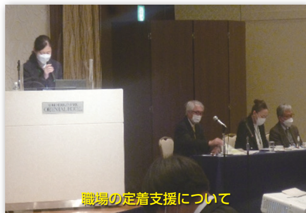
職場の定着支援について