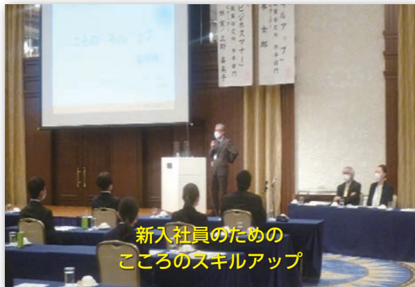
新入社員のための こころのスキルアップ

午後からの「新入社員のためのスキルアップ」では、学卒部門 西本雇用トータルサポーターから、基礎講座の説明の後、今後、仕事で起こりそうな出来事を想定した、認知行動療法とアサーショントレーニングの演習を行い、対応方法を学んでいただきました。